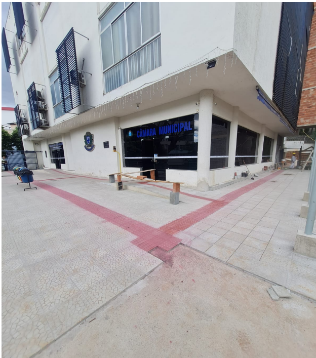
Figura 1 : Instalação ladrilhos