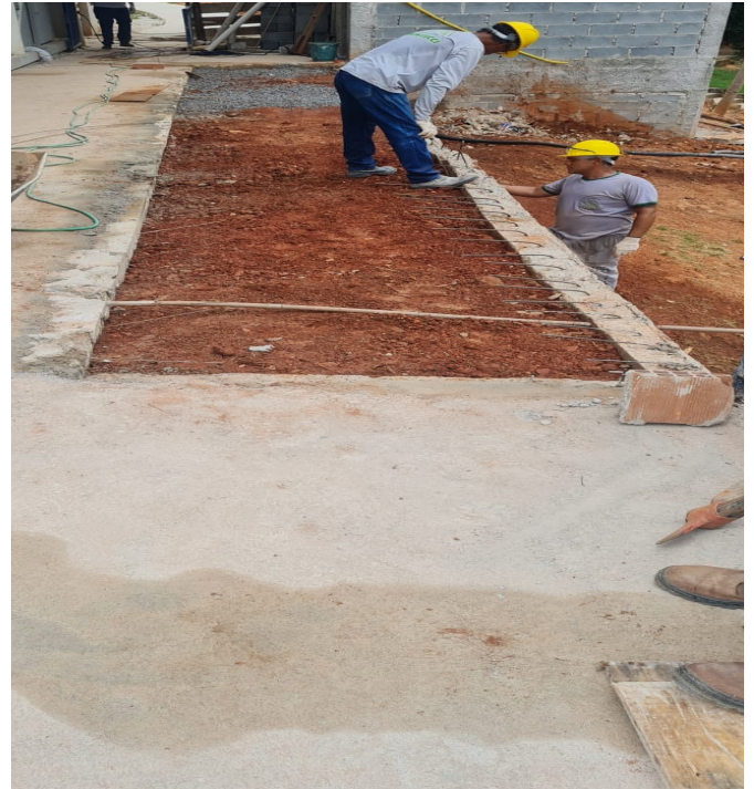
Figura 2 : Concreto Usinado