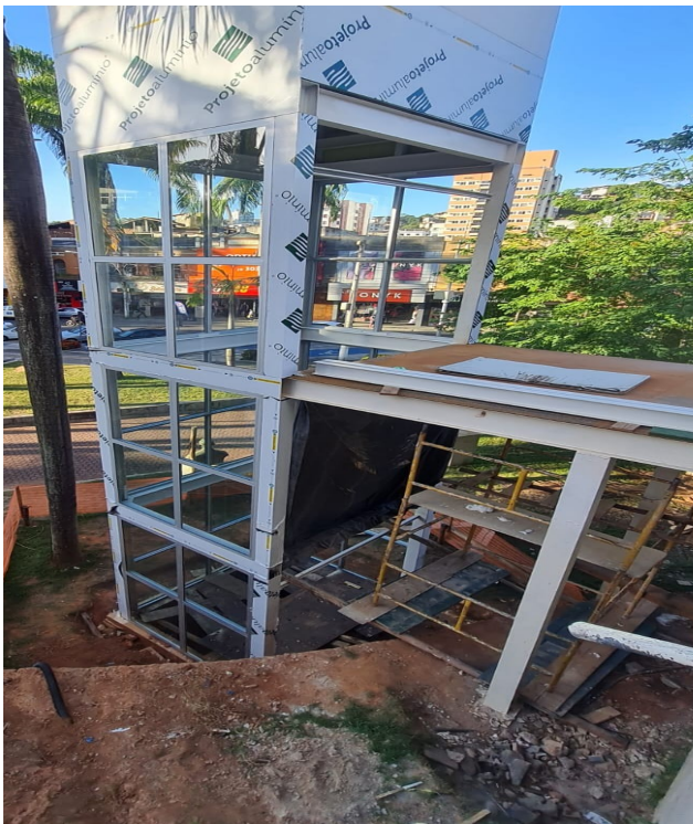
Figura 3 : Instalação vidros Elevador