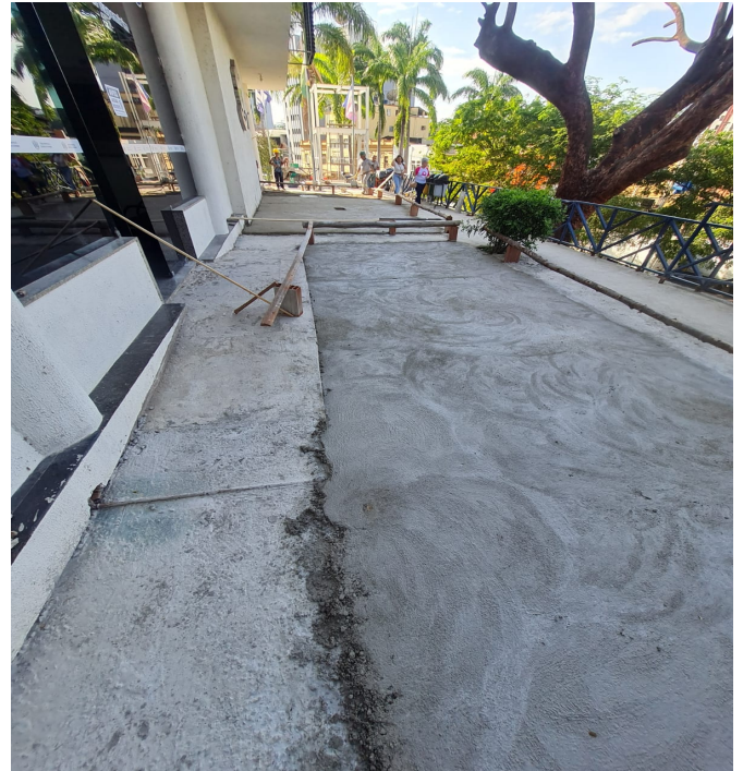
Figura 2 : Regularização de base