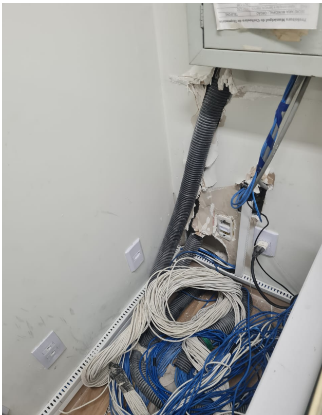
Figura 3 : CABO ELETRÔNICO CATEGORIA 5E