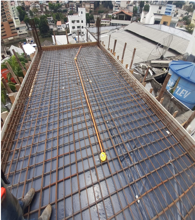
Figura 1 : Fornecimento, dobragem e colocação em fôrma