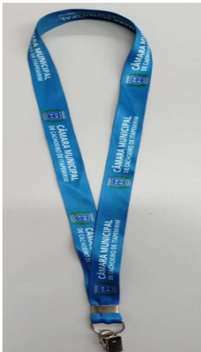
Figura 2: Modelo referencial do cordão personalizado com presilha tipo jacaré