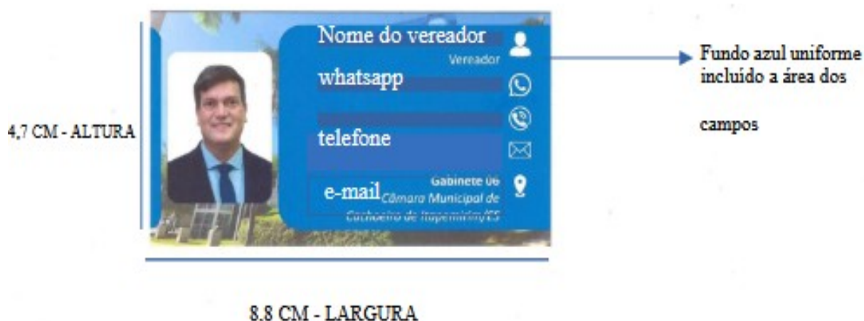
Figura 4: Modelo referencial de cartão de visita institucional

Os materiais deverão apresentar qualidade adequada de impressão, fidelidade às cores institucionais, nitidez das informações, alinhamento visual e acabamento sem falhas, manchas, deformidades ou imperfeições aparentes.