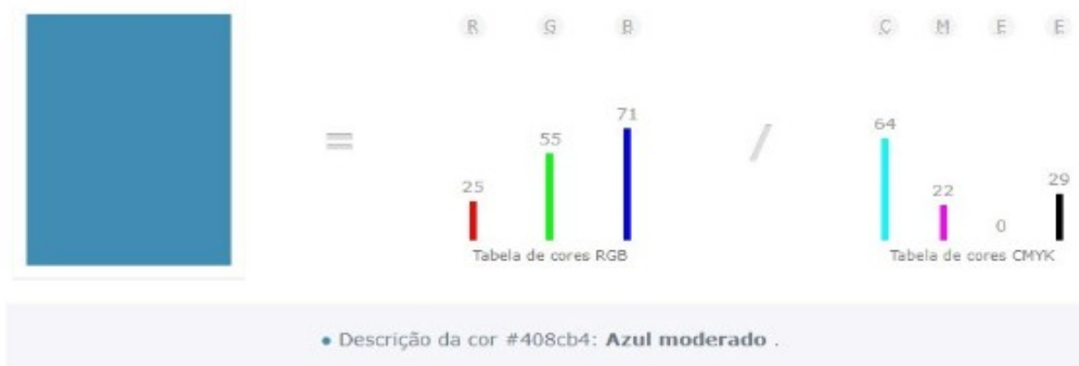
Figura 3: Referência cromática institucional para personalização do cordão

A personalização deverá observar padrão visual institucional em tonalidade azul aproximada HEX #408cb4, admitindo-se pequenas variações decorrentes do processo de impressão e fabricação, desde que preservada a identidade visual institucional da Câmara Municipal.